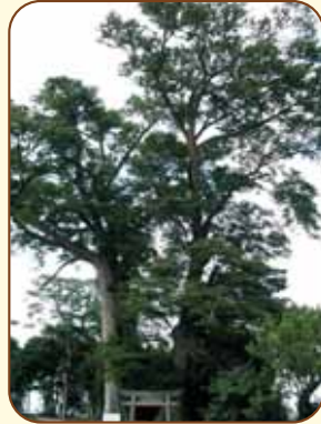
写真の右側は幹周り6m・高さ33m、左側は幹周り5m95cm・高さ26mとされています。(市指定・天然記念物 2本)