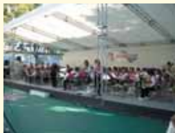
南古谷ウインド・オーケストラ