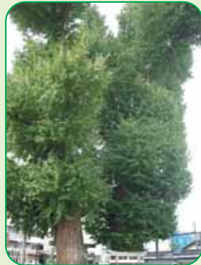
写真の右側は幹周り7m25cm、左側は幹周り5m67cm、高さは二本とも26m50cmとされています。(市指定・天然記念物 2本)