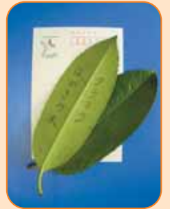
(だんごの串で書いてみました。)

この木はタラヨウといい、葉の裏側に文字が書けることなどから別名「はがきの木」とも呼ばれています。