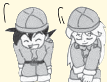
ありがとうございました。