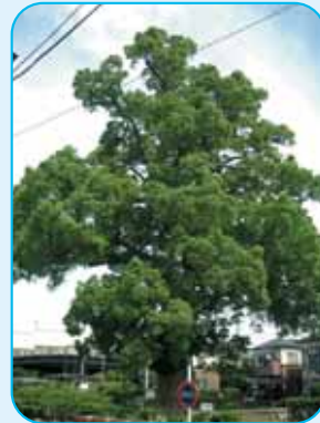
幹周りが6m・高さ32mもあります。近くで見ると大きいよ！