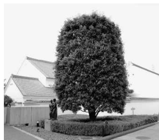
■市の木 かし (昭和57年制定)