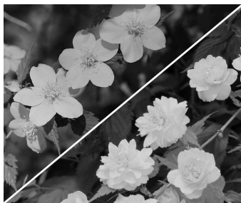
■市の花 山吹 (昭和57年制定)