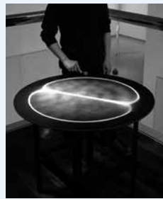
「振動態」円900 2000年