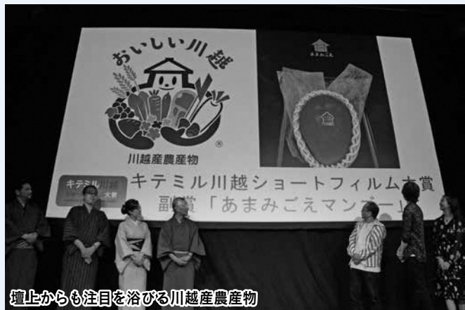
壇上からも注目を浴びる川越産農産物

それぞれの作品の皆さんの参加が、本当に素晴らしい川越の魅力を伝えていくことになるのではないかなと思いますし、ぜひ皆さんにも川越に行っていただきたいです。私は個人的に、マンゴーが食べたいと思いました。