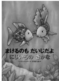
「まけるのもだいたよ にじいろのさかな」 講談社 2017年刊

購入した日から1年間、何回でも常設展・特別展を観覧できる美術館鑑賞定期券を販売しています。経費…1,600円(大学生・高校生800円)