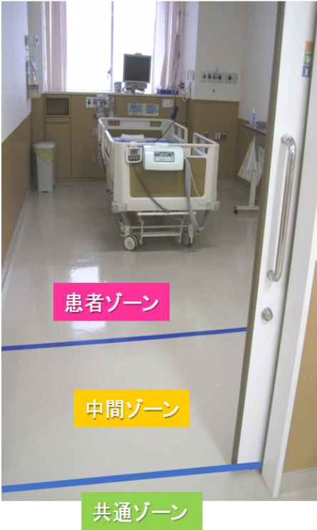
病室ゾーニングの1例