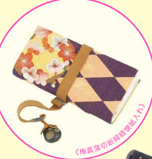
《梅高蒲切袋縮緬煙草入れ》