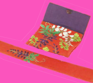
《藤刺繍利休形懐中煙草入れ》