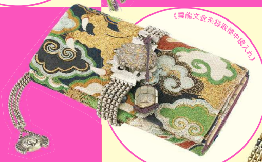
《雲龍文金糸縫取懐中鏡入れ》