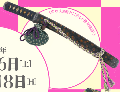
《変わり塗鞘合口帛(小袋裏袋袋)》