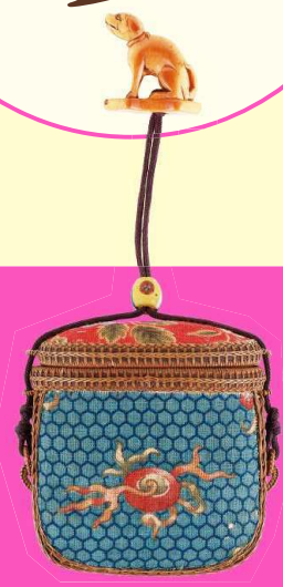
《オランダ更紗嵌込竹編一つ提げ煙草入れ》