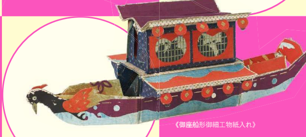
《御座船形御細工物紙入れ》