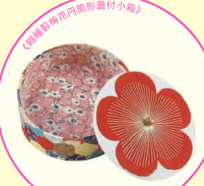
《縮緬刺繍梅花円高形蓋付小箱》