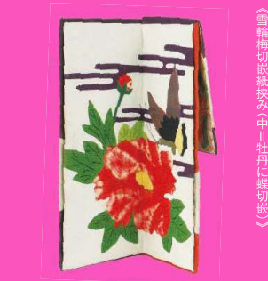
《白梅切紙紙袋(中川牡丹に縁切紙)》