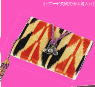
《ピロッド矢掛文懐中鏡入れ》