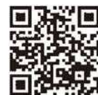
認証キーの取得方法 発注者への提出方法