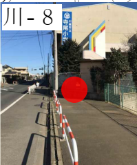
向イ雨水ポンプ場