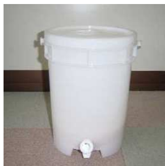
E M容器 (室内用バケツ型容器)