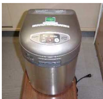
電気式生ごみ処理機