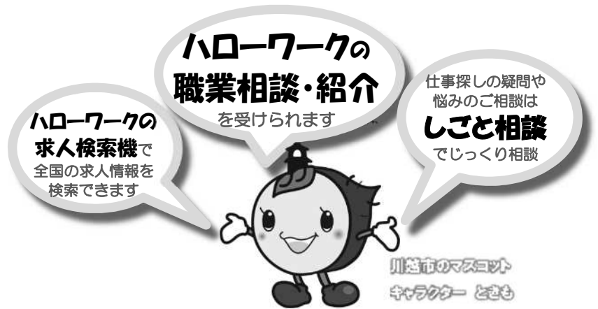
川越市のマスコットキャラクター とさも