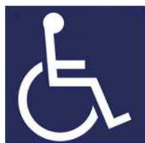
【障害者のための国際シンボルマーク】 所管：公益財団法人日本障害者リハビリテーション協会