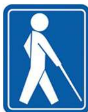
【盲人のための国際シンボルマーク】 所管：社会福祉法人日本盲人福祉委員会