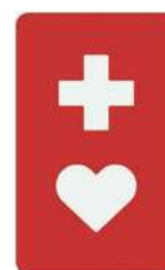
【ヘルプマーク】 所管：東京都