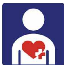
【ハート・プラスマーク】 所管：特定非営利活動法人ハート・プラスの会