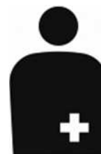
【オストメイト用設備/オストメイト】 所管：公益財団法人交通エコロジー・モビリティ財団