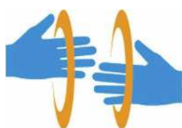
【手話マーク】 所管：一般財団法人全日本ろうあ連盟