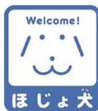
【ほじょ犬マーク】 所管：厚生労働省