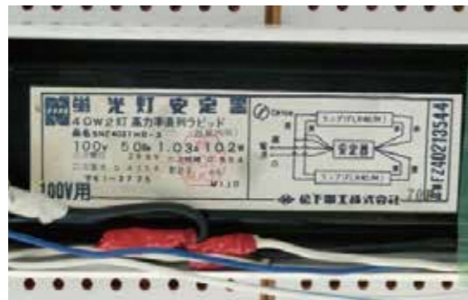
③ 安定器の銘板を確認。