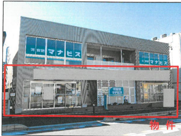
[外観写真 (2021年10月23日撮影)]