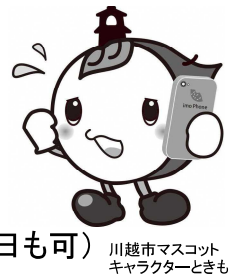
川越市マスコット キャラクターときも