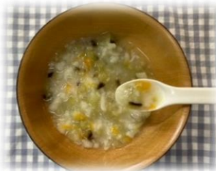
野菜とうどんのトロトロ煮

ゆでたなす、にんじん、うどんを細かく刻み、ひたひたの水と一緒に耐熱容器に入れる。水溶き片栗粉を混ぜ、電子レンジ600wで1分加熱し、とろみをつける。