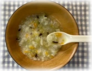
野菜とうどんのトロトロ煮

ゆでたなす、にんじん、うどんを細かく刻み、ひたひたの水と一緒に耐熱容器に入れる。水溶き片栗粉を混ぜ、電子レンジ600wで1分加熱し、とろみをつける。