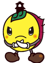
川越市マスコット キャラクターときも