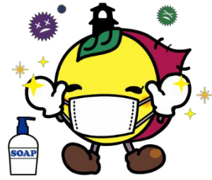
川越市マスコットキャラクターときも