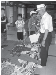
実際に使われる装束

九月十四日(土)、古谷公民館に集合した子どもたちは、地域の皆さんとともに古尾谷八幡神社へ向かいました。途中の古谷本郷下公民館で、本物の「ほろ」を見学。ほろは全て手作りで、毎年新しく作り直すとのこと、子どもたちはびっくり。きれいなほろを興味深く眺めていました。その後、神社の社務所で実際に使われる装束などを見せてもらいました。きらびやかな装束を見て「着てみたい」と話す子どももいました。地元の祭とはいえ、初めて知ったことも多く、子どもたちも目を輝かせていました。