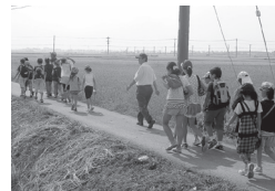
みんなで元気に出発!

たこあげ大会」などを他団体と協力して行っています。地域の皆さんに支えられ、子どもたちは豊かな体験を積み重ねています。