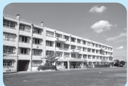
初雁中学校の校舎外壁

夏休み期間中、南古谷小・大東東小・初雁中・城南中学校の4校で大規模改造工事を実施しました。今年度から、老朽化した学校施設の改修を目的として、校舎外壁の塗り替えや、教室の全面改修、トイレの洋式化などを実施する大規模改造工事を順次進めてまいります。夏休みが終わって登校してきた子どもたちからは、ピカピカになった校舎に驚きの声や喜びの笑顔が見られました。