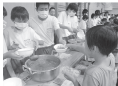
中学生によるカレーの配膳