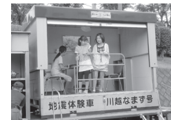
地震体験車・川越なまず号

この防災キャンプは、青少年を育てる南古谷地区会議や自治会など多くの地域の人々との連携と協力によって運営されています。「子どもたちに生き残れる力をつけさせましょう」というスローガンのもと、参加した子どもたちが防災について楽しく学ぶとともに助け合いの気持ちを養う良い機会となりました。