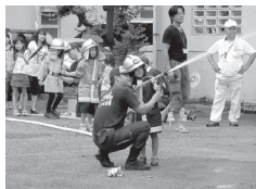
消防士さんと一緒に放水訓練