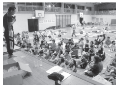
三角巾のしぼり方の説明