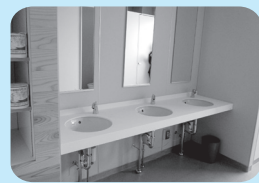
初雁中学校のトイレのoshi