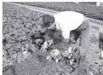
▲収穫中!! 1株に30個くらいのさやがついています。