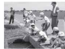
わあーい、ザリガニつり