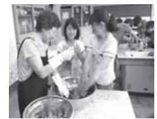
本式です。藍染め体験