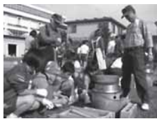
すてい。釜で直火炊き体験

そして楽しみの収穫祭。新 まき くべた釜で最高の炊きたてご飯、学校ファームで収穫したさといも・大根・人参・小松菜・じゃがいもの具だくさんの味噌汁、さつまいもなどを感謝しながら頂きました。生徒も先生も地域の方も笑顔あふれるホットなひとときでした。