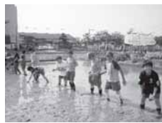
自分たちで植えました!