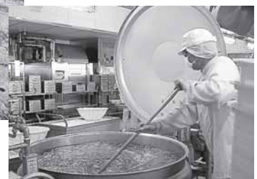
▼調理中!! 大きなお釜で色よく茹で上げます。

市教委だよりNo.102 発行 / 川越市教育委員会教育総務課 TEL(224)6074(直通)