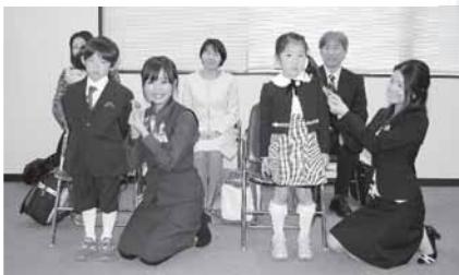
川越市には全部で2,979枚のワッペンが贈られました。