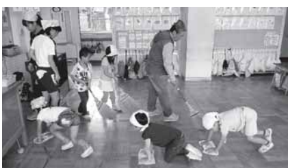
きれいな教室は気持ちがいいね！（写真は武蔵野小学校の様子）