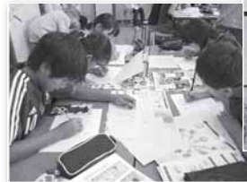
硬貨の図柄を描く子どもたち