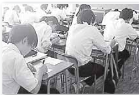
規律ある授業風景