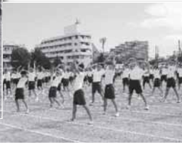
体をしっかり回します