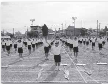
体育祭でのラジオ体操の様子

朝のすがすがしい空気の中でラジオ体操をすることにより、生徒は元気に気持ちよく学校生活を送っています。