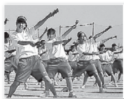
体育祭(よさこい・鳴子踊り)

A 生徒指導の組織体制が確立されることにより、子どもたち一人ひとりの理解が深まります。保護者への連絡、相談などもスムーズになり、教員が落ち着いて対応できるようになります。すると、更に子どもたち一人ひとりに目が届くという、「プラスのスパイラル」ができると考えています。