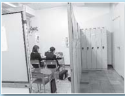
個に応じた相談ができるよう、3つの部屋に分けています