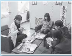
教育相談室の様子

A 問題行動に対して、初期対応をいかに迅速にかつ組織的に進めていくかが鍵と考えます。その体制を確立するため、「特別支援コーディネーター(※)」を設置