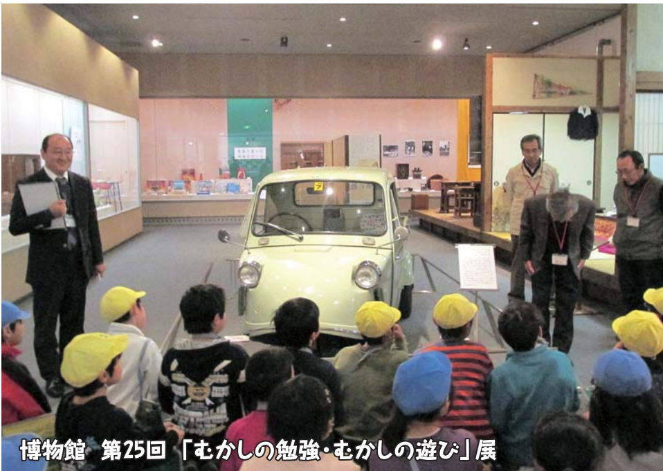
博物館 第25回「むかしの勉強・むかしの遊び」展

同展示は、博物館の収蔵資料から地域の人々の暮らしの移り変わりをたどり、昭和30~40年代の教室・居間・台所や駄菓子屋の店先を再現しています。更に今回の展示では、昭和39年(1964)に製造された三輪自動車や、昭和40年代に家族で遊んだゲームなどを展示しています。