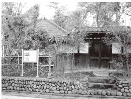
▲市指定史跡の武家屋敷である永島家住宅

新規事業・主要事業は： 新規事業としては、平成二十四年度の耐震化工事の完了に伴い、平成二十五年度から老朽化した学校施設整備を改修するため、「小中学校大規模改造工事設計業務委託」を実施します。 そのほか、市指定史跡の武家屋敷である永島家住宅を広く周知するため、「永島家住宅公開」を始めた。 主要な事業としては、「学童保育室運営管理」を拡充し、安全・安心な学童保育室を目指し、公設公営を徹底し、責任を持って運営を行います。 学校教育では、本市独自の「少人数学級のための臨時講師の配置」やいじめ・不登校等の児童生徒に対する問題を解消するため、全市立中学校に「さわやか相談員の配置」を引き続き実施します。 「中学校指導事務」では、新学習指導要領の全面実施に伴う指導教材等の購入を行います。 また、「学校給食センター運営管理」では、食材の安全を確保し、おいしい給食を安定して供給するとともに、食育の推進を図ります。