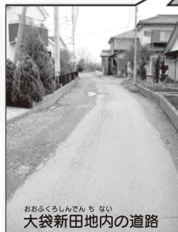
大袋新田地内の道路

駅路は約16kmごとに「駅」があり、使用者の休憩や馬の乗りつぎに使われていました。川越市の場の八幡前・若宮遺跡で見つかった「驛長」と書かれた土器は、付近に駅があったことを示しています。