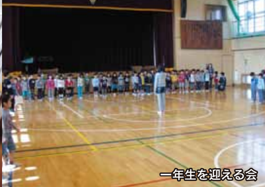
一年生を迎える会