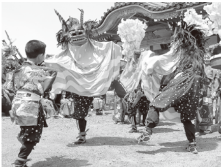
石原町、石原のささら獅子舞

また、体に太鼓をつけて三匹で舞う三匹獅子舞は、東日本の各地でよく見られます。川越の獅子舞は、こうした東日本の獅子舞の特徴をよく伝えていきます。