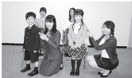
川越市には全部で2,981枚のワッペンが贈られました。