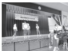
○×クイズに挑戦! どっちかな?

また、中学生たちが中心になって運営した「お化け屋敷や「金魚すくい」、体育館で行われた「スタイリッシュ・ウィンドオーケストラ」のコンサートは、行列ができるほどの大盛況でした。他にも、おもちの無料配布や二十五の体験講座等が校舎内外で行われ、約二千人もの来場者が集まり、楽しい一日を過ごしました。