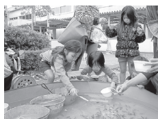
金魚すくいに挑戦です!