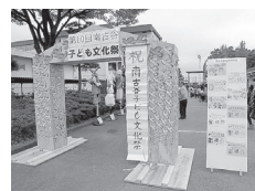
南古谷子ども文化祭ようこそ!