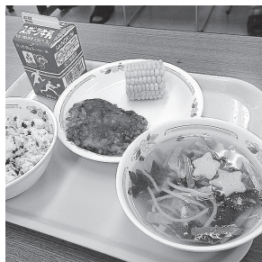
▲給食に川越産とうもろこしが登場!

毎年7月の給食には、川越産の新鮮なとうもろこしが登場します。福原地区の農家の方が、今年も3月頃から種まきをし、現在「ゴールドラッシュ」と「あまいんです」という品種を栽培中です。化成肥料だけに頼らず、たい肥を使用したり、農薬の散布回数をできる限り少なくしたり、さまざまな工夫をして大切に育ててくれています。農家の方のおすすめのおいしい食べ方は、「新鮮なものを蒸してそのままかぶりつく!」「蒸したあとしょうゆをかけてコンロで焼き目をつける!」だそうです。