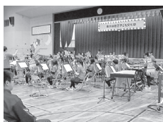
素晴らしい演奏に感動しました!