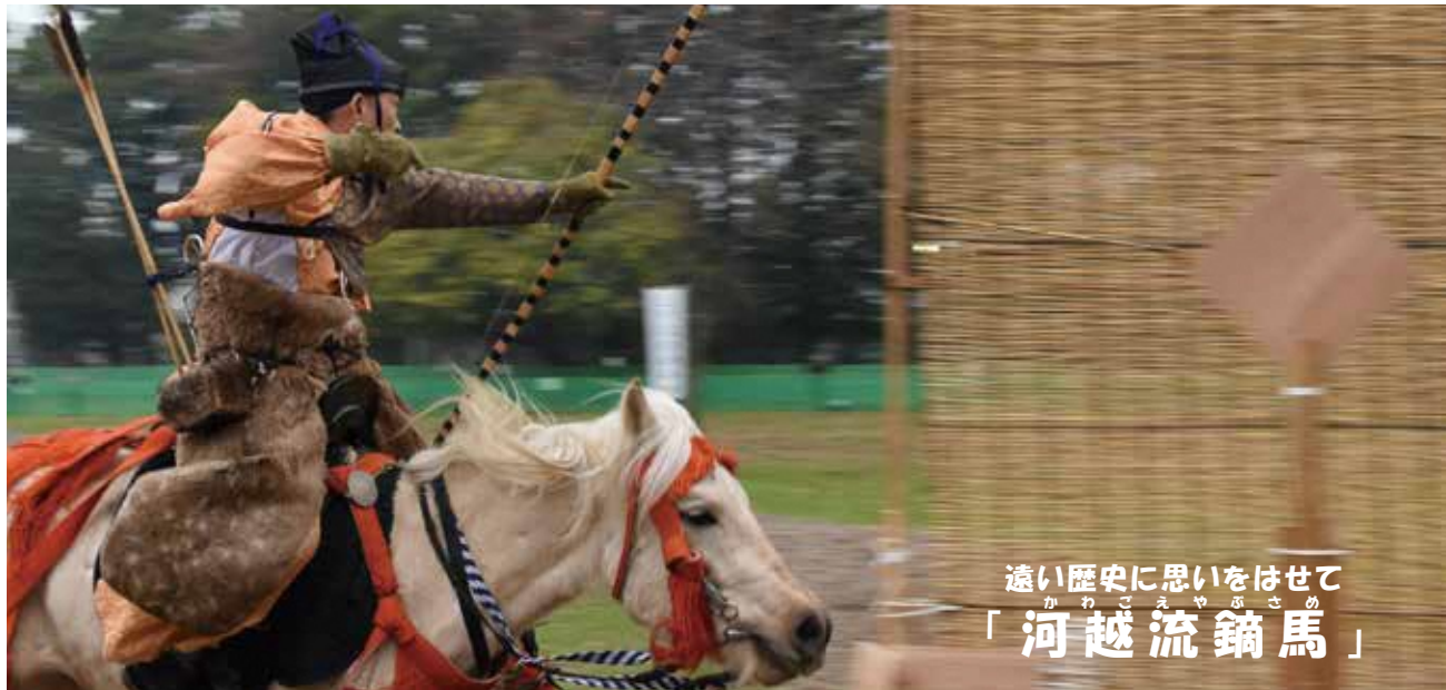
遠い歴史に思いをはせて 「河越流鏑馬」