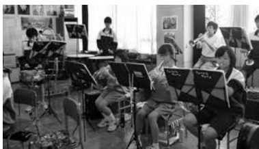
福原中学校吹奏楽部の練習の様子

新しい楽器が加わり、夏の吹奏楽コンクールに向け、子どもたちは一層熱心に毎日の練習に励んでいます。