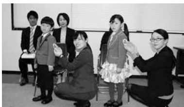
川越市には全部で3,089枚のワッペンが贈られました。

新小学1年生は贈呈式で「黄色いワッペン」を付けてもらい、交通安全を元気に誓いました。