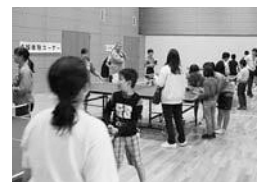
楽しく学んでいます!

毎年秋に行われる「子どもフェスティバル」は昨年度から舞台を大東市民センターに移し、行われました。