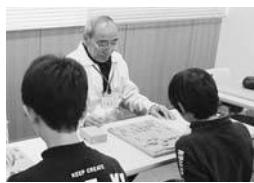
地域の方といざ勝負!!

昔のお菓子作りや実習室、昔遊び、囲碁・将棋体験等、体験を通じた学びの場が設定されています。