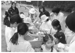
我楽多コーナーの様子

中央地区では、「自分の責任で自由に遊ぶ」をテーマとして、「こどものくに」児童遊園館」を開催しています。地域の方々の協力のもと、段ボールジャンブルや割りばし鉄砲を作るコーナー、紙コップを使ったけん玉を作るコーナー等、子どもたちが自分で遊び方を考え、工夫して遊ぶ活動を行っています。