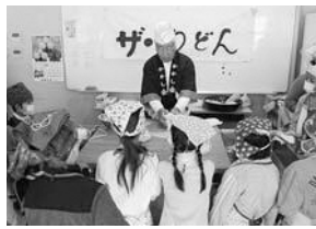
うどん作りに挑戦!

他にも中央地区では「自分で作ったものを、その場で食べる楽しさを知ろう」をテーマに、「うどん作り体験」を実施しています。これは公民館を会場に、川越第一小学校、中央小学校、仙波小学校の児童を対象として、各学校一日ずつ行われる体験教室です。