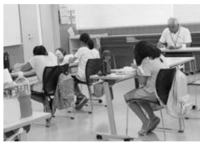
みんな一生懸命です!

夏休みには「夏休み寺子屋大東教室」が行われ、児童は算数や国語の宿題に取り組みました。大東市民センター2階の会議室を会場として、子どもたちは熱心に勉強に取り組んでいました。