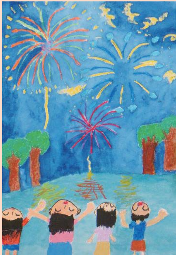
「家族で見た伊佐沼の花火大会」