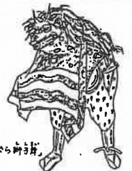
名前のでら獅子頭