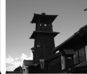
とき 30 時の鐘