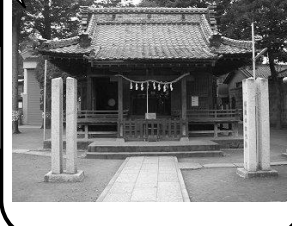
くまのにんじや 20 熊野神社