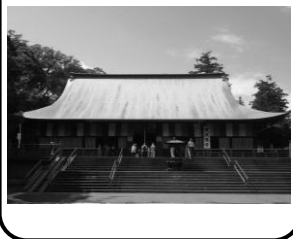
きたいん 60 喜多院