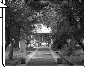
みよしのにんじや 90 三芳野神社