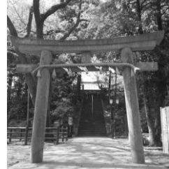
せんばとうしやうぐう 70 仙波東照宮