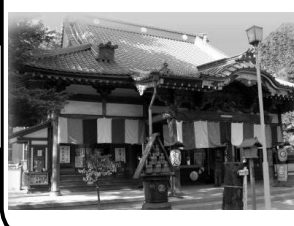
れんはいじ 10 連繫寺