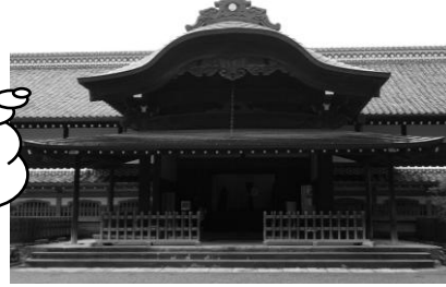
ほんまるごてん 100 本丸御殿