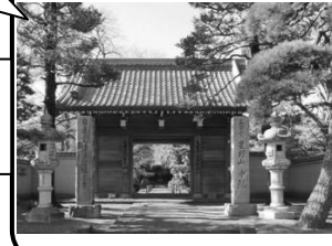
なかいん 80 中院