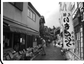
かしやよちやう 40 菓子屋横丁