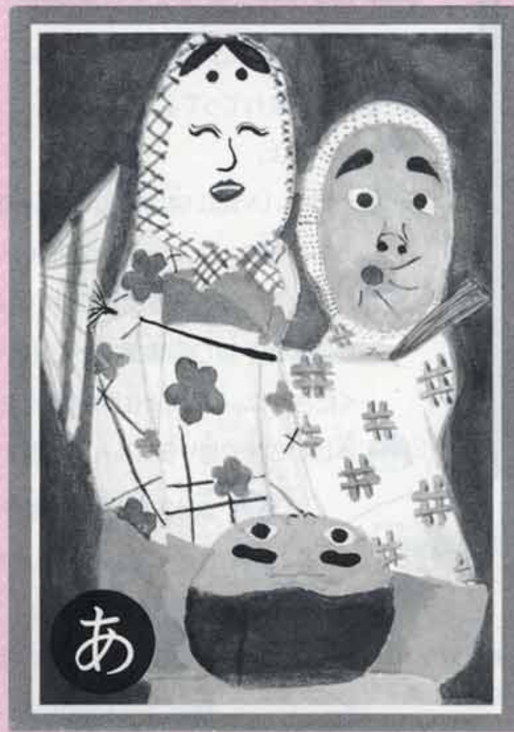
絵:かわごえ郷土カルタより (南田島の足踊り)