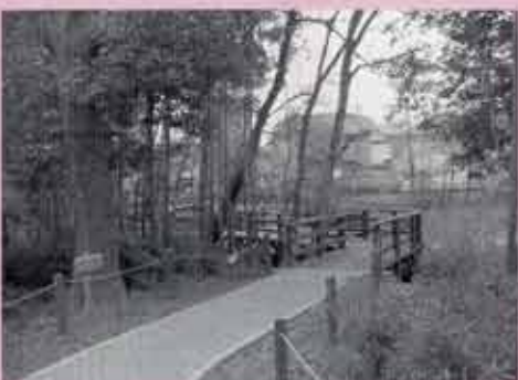
公園には遊歩道もあるよ