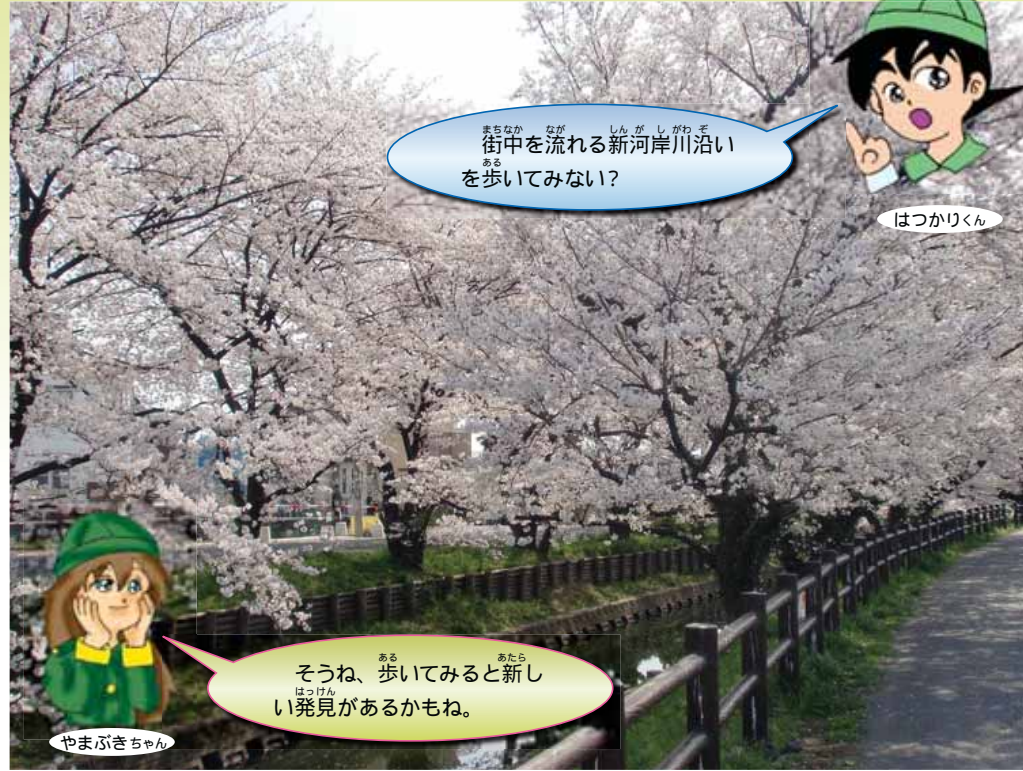
北公民館前の春の新河岸川