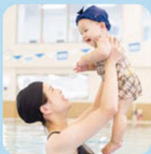
ベビー(親子)クラス