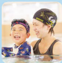
キッズ(親子)クラス