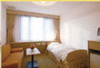
入院室(6タイプ) ※全60室個室