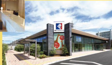
恵愛こどもクリニック (2022年8月開院)