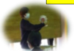
歯科衛生士さんによるブラッシング指導