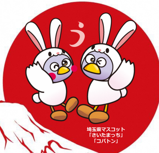
埼玉県マスコット 「さいたまっち」 「コバトン」