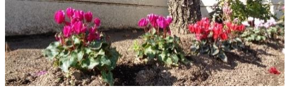
校門前のシクラメン

1年で最も長い2学期も、本日終業式を迎えました。2学期が始まった時は寒い季節を想像できないほどの暑さでしたが、今は師走となり2023年も残すところあとわずかとなりました。