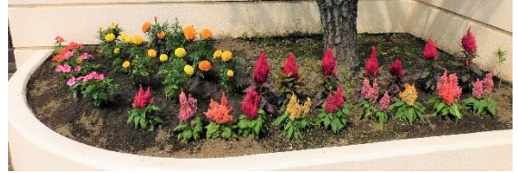
近隣の方が植えてくださった校門の花々。美しく咲いています。

学校総合体育大会川越市予選会が開催されました。どの部も3年生を中心にこれまでの練習の成果を十分に発揮できたことと思います。予選会を終えて部活動を引退する3年生も大勢います。夏の暑さや冬の寒さの中で練習を積み重ねてきたことは、中学校生活の貴重な経験となったことでしょう。何よりも仲間たちと切磋琢磨して続けてきた練習の日々は、これからの人生を支える土台であるとも言えます。苦しいことから逃げずにがんばった経験を誇りに思ってください。これは、学校の部活動に参加している人だけの話ではありません。学校外でも多くの生徒のみなさんがクラブチームなどに加入して、学校の部活動と同様に努力をしています。これまで子どもたちの活動を支えていただいた保護者の皆様に心より感謝申し上げます。保護者の皆様が子どもたちの心の支えとなっていたからこそ、子どもたちは頑張り抜くことができました。