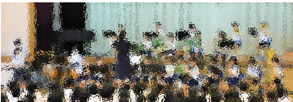
吹奏楽部演奏会 7月19日(水) 8月5日に行われる吹奏楽コンクール 西部地区大会を前に、コンクールで演奏する曲を全校生徒に披露しました。