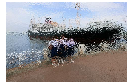
校外学習(3年生) 横浜 6月23日(金)