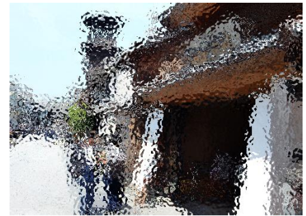
校外学習(1年生) 川越めぐり 7月7日(金)

みなさん1人1人が安全に留意して、充実した夏休みを過ごすことを願っています。そして、2学期もまた霞西中の仲間とともにがんばっていきましょう。