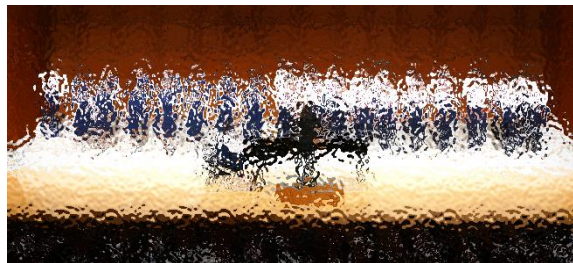
学校代表として市内音楽会で歌声を披露（3-1）

11月8日（水）3年生とかがやき学級の合唱コンクールが行われました。3年生の厚みのある豊かなハーモニーと、かがやき学級の2度目の美しい演奏が体育館いっぱいに響きわたりました。