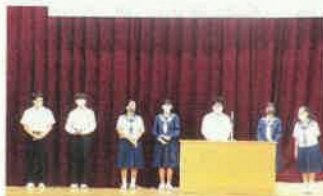
新部長(代表)あいさつ

新部長の皆さん、頑張ってください。前期専門委員の皆さん、ありがとうございました。