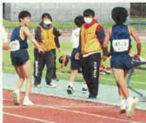
男子のレースの様子