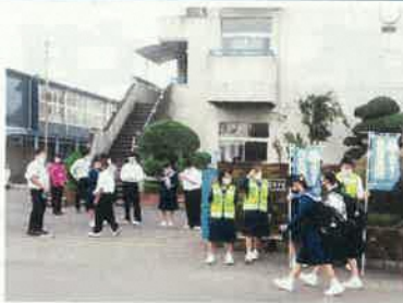
あいさつ運動と募金活動のようす

10月6日、7日に生徒会によるあいさつ運動と募金活動が行われました。また、6日には、PTAの環境保健委員会の皆様と教員との登校指導がありました。保護者の皆様には、ご多用の中ご協力いただきまして、ありがとうございました。これからも「あいさつ」と「安全な登下校」に、全校生徒で取り組んでいきます。