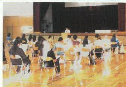
進路説明会のようす

今後も埼玉県教育委員会や県立、私立高校等からの進路情報などを積極的に収集し、生徒や保護者の皆様に「進路だより」などを通して、お知らせしていきますので、お子さんの進路決定に向けまして、ご協力の程、お願い申し上げます。