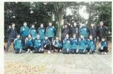
大会終了後の記念撮影