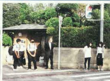
登校指導のようす