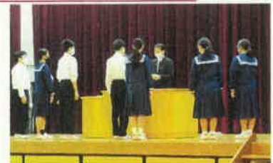
任命書授与の様子

そして、生徒会本部役員の方々の皆さん、全校生徒226名の代表として、鯨井中学校の顔として、これからの1年間、全校生徒(鯨井中)のために本部役員全員で協力し合って、よりよい学校づくりに取り組んでいってください。