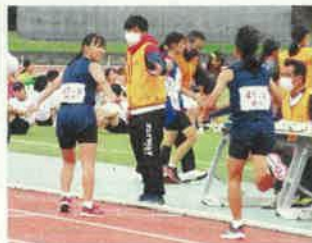
女子のレースの様子