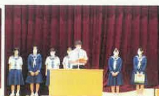
各前期専門委員長より