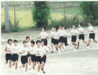
大会に向けての練習風景