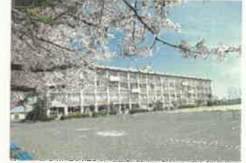
満開の桜 令和4年4月2日撮影

保護者の皆様のご協力により、本日入学式、始業式を挙行することができました。ありがとうございました。今年度も新型コロナウイルス感染症拡大予防