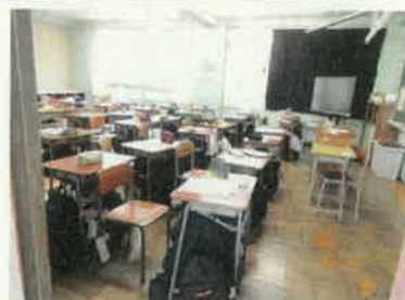
避難訓練のようす（1年生）

まずは、「自助」として、いざという時に自分や家族の命を守るために、事前の避難経路の確認や防災グッズの準備等に取り組んでみてください。また、ご家庭でも大きな地震や台風がきた時の対策について時々話題にしてみてください。