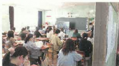
学級懇談会のようす

※ご多用の中、全校保護者会へご参加いただきましてありがとうございました。今後の保護者会への出席や体育祭等の行事への参観につきましてもよろしくお願いたします。