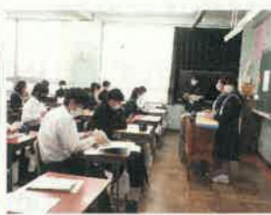
専門委員会（給食委員会）