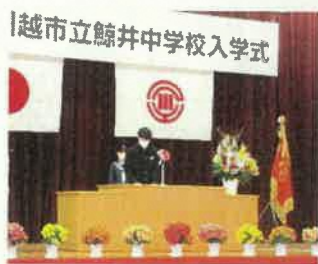
始業式での2、3年生代表の言葉

これからも皆さん一人一人が、明日も学校に行きたいという気持ちになる学校づくりを引き続きしていきましょう。