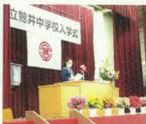
入学式での1年生代表の言葉