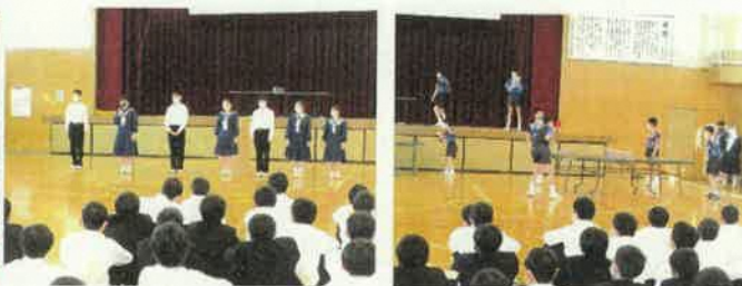
生徒会オリエンテーション(本部役員紹介、部活紹介)