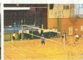
部活見学（バレー部）