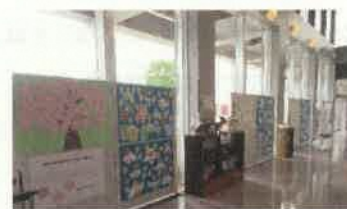
展示期間 4月20日～5月31日

※名細市民センターで本校の美術部が協力した「夢・希望・今の思いや願い」の展示会が開催されています。風船や桜の花びらに小学生や中学生が書いたものを張り付ける下絵（木の幹や雲など）を担当しました。