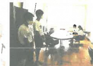
生徒朝会(オンライン)