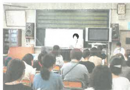
2学年保護者会のようす(音楽室)