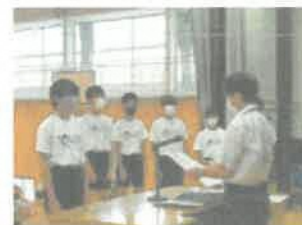
表彰朝会の様子（バレー部）

頑張っている場所は違いますが、一人一人がそこで一生懸命努力して得られたもの（残ったもの）を大切に、将来の自分のためにそれらを活かして行ってください。皆さんの活躍をこれからも期待しています。