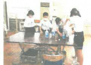
保健委員会(消毒液の補充)