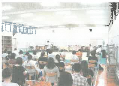
1学年保護者会のようす(武道場)

当日は、ご多用の中、また雨が降りお足下の悪い中、多数の皆様にご参加いただきましてありがとうございました。保護者の皆様のご協力により1学期も大きな事件や事故もなく夏休みを迎えようとしております。夏休み期間中は、ご家庭で過ごす時間が多くなりますので、ゆっくりとご家族でお話する時間などをつくってみてください。