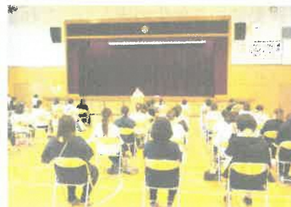
3学年保護者会のようす(体育館)