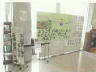
↑名細市民センター1階