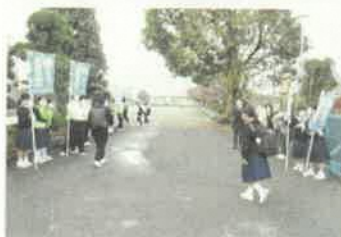
PTAと合同のあいさつ運動

さて、今週より生徒会本部役員をはじめとして各専門委員会の後期の活動が始まりました。11月8日（月）に最初の後期の第1回専門委員会と評議委員会が開かれ、その会議を受けて9日（火）に生徒朝会が体育館で行われました。朝会の中で、各専門委員長の皆さんから今月の取組の説明などがありました。後期も生徒会活動を通して鯨井中学校を安全で安心して皆仲良く楽しく生活できる学校にしていってください。