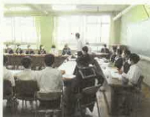
後期第1回評議委員会