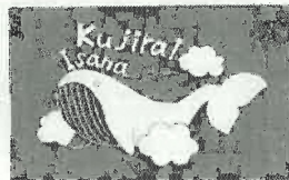
PTAマスコット「勇魚(イサナ)」