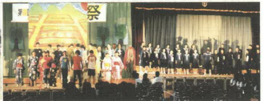
第20回の体育祭での入場行進、終(ひいらぎ)祭でのクラス出し物、合唱祭でのクラス合唱のようす