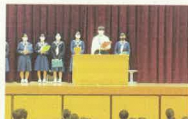
生徒会本部による第1回生徒朝会