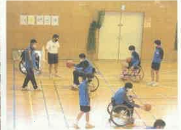
車椅子バスケット体験