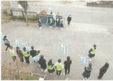
生徒会本部&学級委員会によるあいさつ運動

また、この2学期の反省を活かして、鯨井中学校を3学期も安全で安心して勉強や生徒会活動、行事などに取り組むことができ、よき思い出がたくさん残る学校にしていってください。