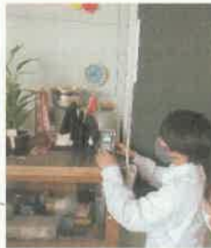
二酸化炭素濃度測定器の設置