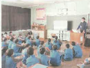
障害者スポーツの講義

12月10日(金)に埼玉県障害者交流センターの方を講師として招き、パラスポーツについての学習と車椅子バスケットボール体験をしました。2年生は非常によく取り組んでいました。これからも障害者スポーツやパラリンピックについての理解を深めていってください。