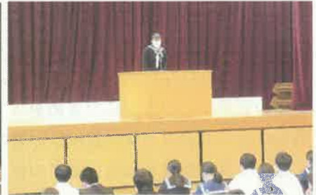
合唱祭実行委員長から合唱祭に向けての話