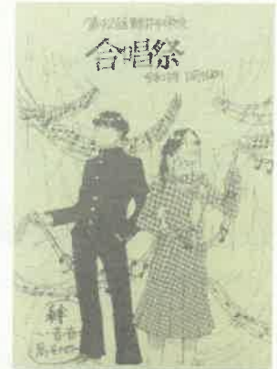
合唱祭プログラム表紙

残念ながらオンライン配信をご覧になれなかった3年生の保護者の皆様は、12月の三者面談時間に理科室で、1、2年生の保護者の皆様は、3月の学年保護者会で上映予定ですので、ぜひご覧ください。